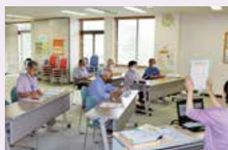
6月開催「成年後見制度」