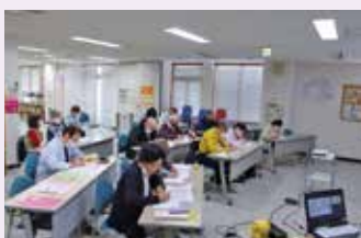
5月開催「エンディングノート」