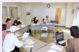
8月開催「情報交換会」